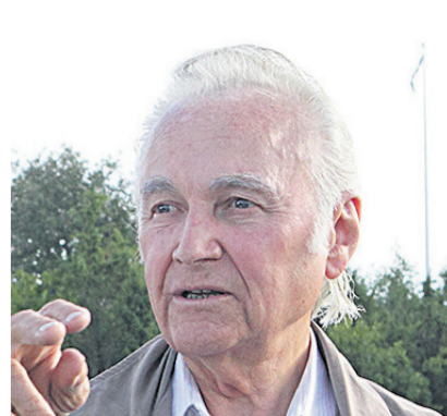
ARNOLD RÜÜTEL saarlasest president

Mulle meeldib käia Koigi rabas – sinna saab nüüd mitmest otsast ja hea on kõik järved üle vaadata. Minu jaoks on see kodulähedane koht, aga ega sinna väga nobedasti ka ei pääse. Rabasse aitas minna igal ajal, nii hommikul vara kui ka õhtul hilja. Koigi raba meeldib mulle just looduse pärast, mis annab tõelise rahutunde. Saarlasele on tähtis ka Muhumaa ja seal on minu lemmik Koguva küla koos muuseumi ja sadamaga, kus tihti ka suvised üritusi toimub. See küla juba ise on väärtus! Ouline on muidugi ka Kuressaare linn, kus mulle väga meeldivad losipargi rajad ja teed. Linna ümber on niivõrd head jalgrattateed ja neid ei jõua kõiki läbivi sõita, enne võib ära väsida. Tore koht on Loode tammik – lühike rattasõit ja oledki otse looduses, kus orhideedki kohe õitsemist alustavad. Neil, kes Saaremaal varem käinud pole, soovitan tingimata käia Kuressaare lossis, aga ka niinimetatud piimaringil ehk Pangal, Anglas ja Kaalis. Kui aega on rohkem, tasub ikka Sõrves ka ära käia.