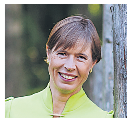
KERSTI KALJULAI Saaremaa juurtega president

Kuressaare keslinnas on üks viitadega post. Kõik viidad sellele näitavad ise suunda, kuid tekst on kõigil sama – MERI. Kõik on öeldud. Ilma mereta ei ole Saaremaad. Mere äärde võib alati minna. Eriti uhke on see siis, kui ilm on veidi karvarem. Müha kurdistab kõrvu, õhk lõhnab adrust kirbelt, lendlevad spoolased veepisad tikuvad suhu, silmad neelavad lainete mõlu ja tuul trügib pikali sellise jõuga, et tahaks kukkumisest hoidumiseks teemast endast kinni haarata. Ei maksa imestada, kui kõige selle sees alles tuleb tahtmine lihtsalt erutusest ja vabadusetundest karjuda. Soojal suvepäeval võib Harilailu rannal kõndides kuulda tulikuuma liiva laulmist ja türkiisinisele merele vaadates tema lummuessesse langeda. Külmal talvepäeval võib mere kaanetanud jääväli ulatuda silmapiirini või lumetuisus sulada kõige ümbritseva üheks valgeks maailmaks. Meri on elusolend. Tal on omad näod ja tujud. Merega tuleb läbi saada. Teda kuulata ja temaga suhelda. Teda austada.