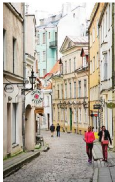
Ett besök i den gamla Hansastaden Tallinn öppnar upp för sköna spaupplevelser.

Pärnu är också något av Estlands partyhuvudstad sommartid. På den magnifika stranden ligger flera beachklubbar, och i de centrala delarna håller nattklubbarna öppet till sent. Populära Apteke är beläget just i ett gammalt apotek, och stilrena nattklubben Sugar har utsetts till stadens bästa nöjesetablissemang flera år i rad.