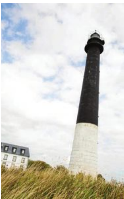
Saaremaa är genuint estniskt med en orörd natur, väderkvarnar, fiskelägen och traditionella stugor med halmtak.