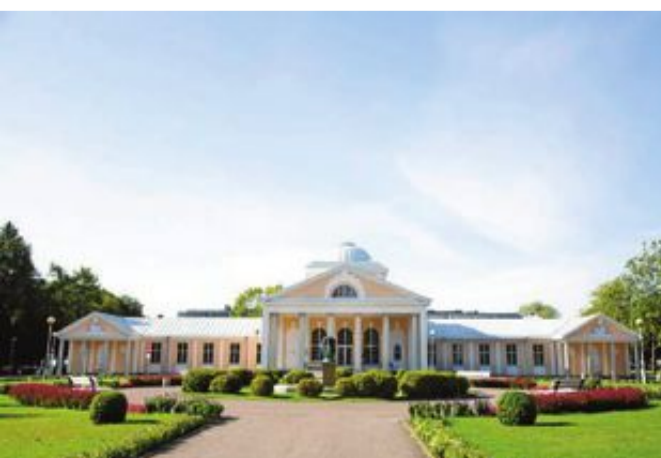
Hedon Spa hotell är ett av många välgörande ställen i Pärnu.

Raimond, Pärnu: Med ett suveränt läge precis vid havet bjuder Raimond hög klass och kunnig och trevlig personal. Maten är inspirerad från nordiska rena smaker och man använder sig av lokala och närproducerade råvaror. Adress: Ranna puistee 1, Pärnu. (TT)