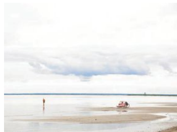
Pärnu har Estlands fetaste strand, över sju kilometer mjuk sand finns att breda ut sig på.