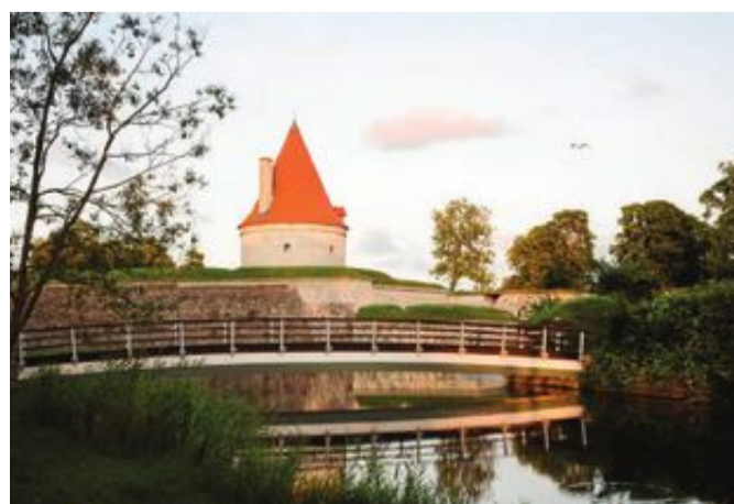
Biskopsborgen från 1200-talet kikar upp vid flodstranden i Kuressaare.