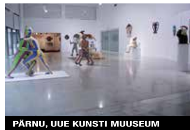
PÄRNU, UUE KUNSTI MUUSEUM

L'estate estone è ricca di eventi, a partire dalla capitale. Tra i più popolari, i Tallinna Merepäevad , i giorni del mare ( www.tallinnamerepaevad.ee ), dal 15 al 18/7, con appuntamenti nautici, gastronomici e musicali. Sempre nella capitale, tra le rovine del monastero di Pirita dal 4 al 13/8 va in scena il Birgitta Festival ( www.filharmoonia.ee/en/birgitta ), per gli amanti della classica. Kuressaare dedica ai melomani il Saaremaa Ooperipäevad ( www.saaremaaopera.eu ), dal 14 al 22/7, cui risponde Haapsalu con un appuntamento per i fan del blues: Augustibluus ( www.augustibluus.ee ), in agenda il 4 e 5/8. Negli stessi giorni (3-5/8) sulla spiaggia di Pärnu si radunano i più giovani per il Weekend Festival Baltic ( www.weekendbaltic.com ), un'invasione di dj da tutto il Pianeta.