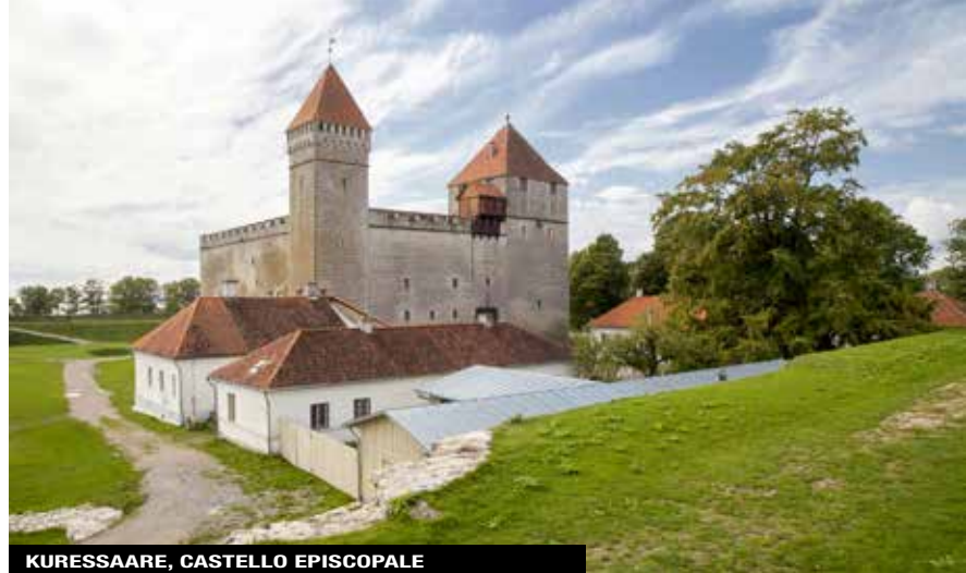
KURESSAARE, CASTELLO EPISCOPALE