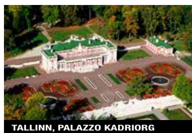
TALLINN, PALAZZO KADRIORG